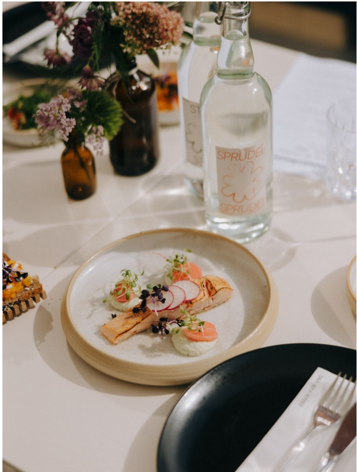
Afterwork mit Kollegen